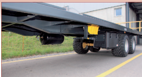
Grosse Nutzlast dank statisch optimierter Bauweise. Auf Wunsch grosser Werkzeugkasten.