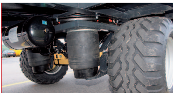
Luftfederung mit Niveauregulierung und Absenkfunktion