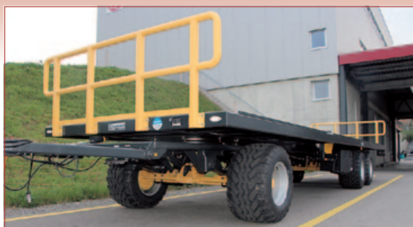
Grosse Ladefläche und geringe Brückenhöhe. Front- und Heckabschlüsse nach Wunsch.